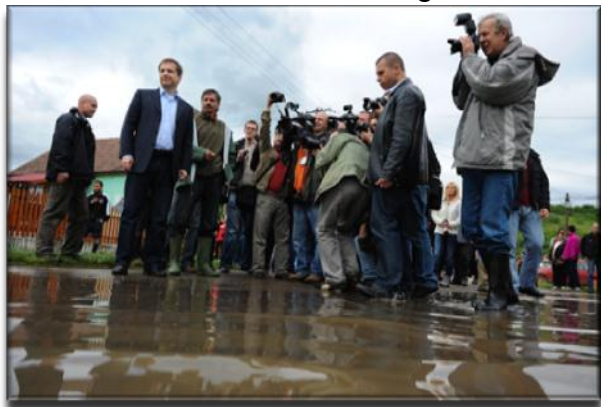
Bajnai Gordon Felsőzsolcán

A Bajnai-kormányzat habitusa, amely egyrészt a miniszterelnök kissé technokrata stílusából, másrészt a válságkezelő kormány (amely ekkor már ügyvezető volt csak)