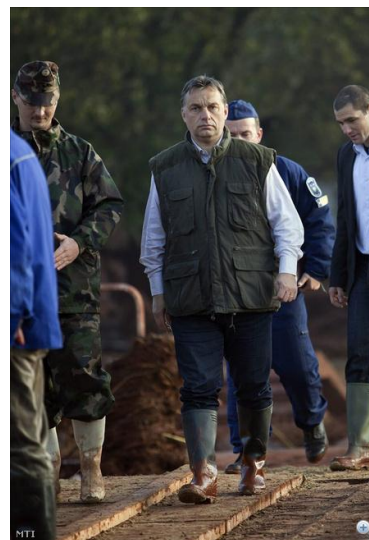
Orbán Viktor Kolontáron

Az Orbán-kormány az együttérző képesség területén ezzel szemben nagyon jól teljesített, a belügyminiszter keresetlen elszólása, – miután a MAL Zrt. vezetője kijelentette, hogy vízzel lemosható az iszap – hogy „akkor fürödjön meg benne” a károsultak elkeseredettségével, dühével való azonosulás érzését teremtette meg. Maga a kormányfő több politikai elemző szerint is kiválóan teljesített a katasztrófa napjaiban. Megrendültsége, őszintesége mellett végig határozott vezetőnek mutatkozott, akire a legkomolyabb vészhelyzetben is számítani lehet.