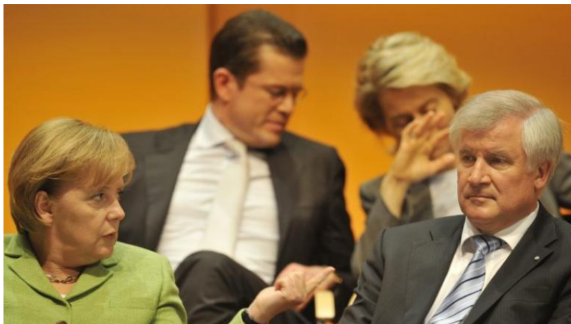
Angela Merkel (CDU) és Horst Seehofer (CSU) a két párt programalkotó gyűlésén

aztán kinek-kinek kell élnie. Mindennek következtében a CDU/CSU jelentősen, mintegy 14 százalékponttal vezet ellenfele előtt a közvélemény-kutatások szerint.